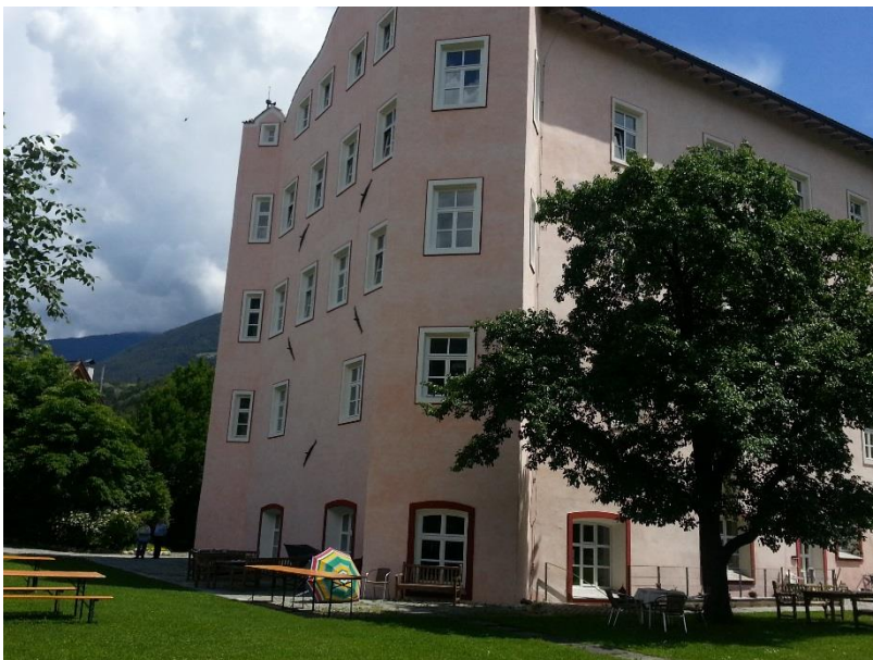
Cusanushaus St. Georg, Sarns 10, I 39042 Brixen/Südtirol

Auf Ihre Teilnahme freut sich das Vorstandsteam der KAB Ingolstadt-Etting